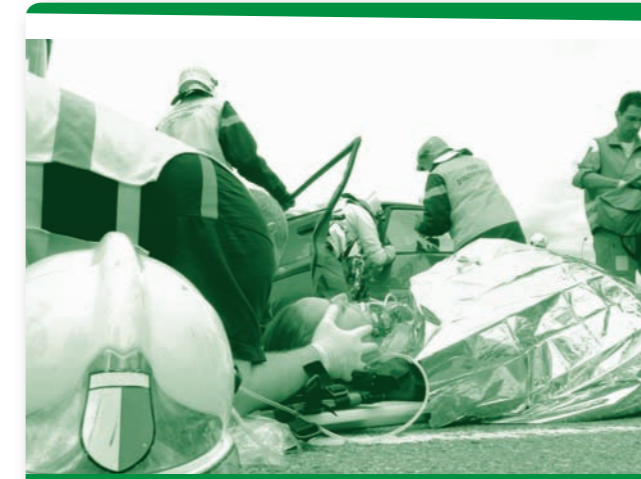
Produktgruppen 1: KONZEPTION UND KOORDINATION

Die Produktgruppen Konzeption und Koordination (Bevölkerungsschutz, Kulturgüterschutz) umfasst die Planung und Weiterentwicklung des Bevölkerungsschutzes inklusive der Aspekte der Nationalen Sicherheitskooperation. Dies bedeutet insbesondere die Koordination des Bevölkerungsschutzes und der anderen sicherheitspolitischen Instrumente. Die Konzeption und Koordination befasst sich mit der Weiterentwicklung der Koordinierten Bereiche (Telematik, ABC-Schutz, Sanität, Verkehr, Wetter, Lawinen, Requisition). Ausserdem steuert und koordiniert sie den Aufbau des Sicherheitsnetzes Funk (POLYCOM), überwacht Rechtsanwendungen im Bereich des Bevölkerungsschutzes und des Zivilschutzes und steuert den Kulturgüterschutz.