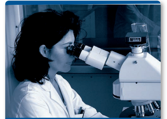
Produktgruppe 2: LABOR SPIEZ

Die Produktgruppe LABOR SPIEZ (Physik, Biologie, Chemie, ABC-Schutztechnologie) erarbeitet und sichert das für einen umfassenden ABC-Schutz erforderliche Grundlagenwissen und stellt es den zivilen und militärischen Behörden zur Verfügung. Sie stellt für den Fall eines Ereignisses mit akuter ABC-Gefährdung in Zusammenarbeit mit dem Kompetenzzentrum ABC der Armee die Einsatzbereitschaft der notwendigen Mittel sicher und unterstützt mit fachtechnischer Beratung und Laboruntersuchungen die nationalen Behörden bei der Umsetzung von Rüstungskontrollabkommen und internationalen Bemühungen zur Nichtverbreitung und Abrüstung von ABC-Waffen.