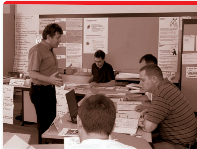
Produktgruppe 4: AUSBILDUNG

Die Produktgruppe Ausbildung (Lehrpersonal, Führungsorgane, Führungsunterstützung, Zivilschutz) deckt die Ausbildung im Rahmen der Nationalen Sicherheitskooperation mit Schwerpunkt Bevölkerungsschutz ab, befasst sich unter anderem mit der Rekrutierung im Zivilschutz und mit Einsätzen des Zivilschutzes zu Gunsten der Gemeinschaft und betreibt das Eidgenössische Ausbildungszentrum (EAZS) in Schwarzenburg.