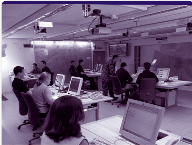
Produktgruppe 3: NATIONALE ALARMZENTRALE

Die Produktgruppe Nationale Alarmzentrale (Lage, Warnung und Alarmierung) deckt die Früherkennung und Beurteilung von Ereignissen ab, welche die Sicherheit der Bevölkerung tangieren können. Sie stellt die bevölkerungsschutzrelevante Lage für die Behörden des Bundes und der Kantone dar. Schliesslich warnt sie die Behörden und alarmiert, in eigener Kompetenz oder im Auftrag.